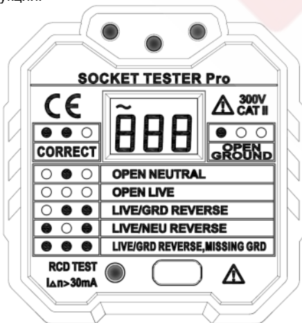
Модель с жидкокристаллическим дисплеем

Прежде чем приступить к работе с тестером, внимательно прочтите инструкцию по эксплуатации и строго соблюдайте правила техники безопасности, а также предупреждения, приведенные в этой инструкции.